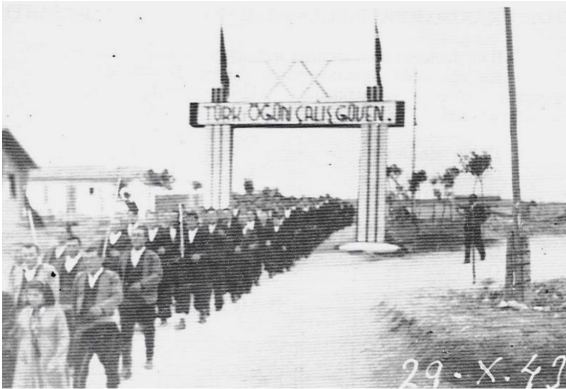
Göl Köy Enstitüsü, Cumhuriyet Bayramı kutlamaları, Kastamonu - 1943

Bir kez daha vurgulamak gerekirse, bazı detaylarda yapılacak eleştiriler, böyle büyük bir projenin değerini düşürmediği gibi, o günden bugüne, bir daha aynı büyüklükte bir "düşünce" ve "planlamaya" rastlayadığımızı, üzülmek ifade etmek durumundayım. Ancak olumlu taraftan bakarsak, o günün zor koşullarında bunlar başarılabilirdiğine göre, bugün çok daha fazlasını neden başaramayalım, diye kendi kendime soruyorum. Köy Enstitüleri Projesi'nin günümüz koşullarına uyarlanmış probleme dayalı öğrenme modalarını başta üniversitelerimiz olmak üzere denemeye ne dersiniz!