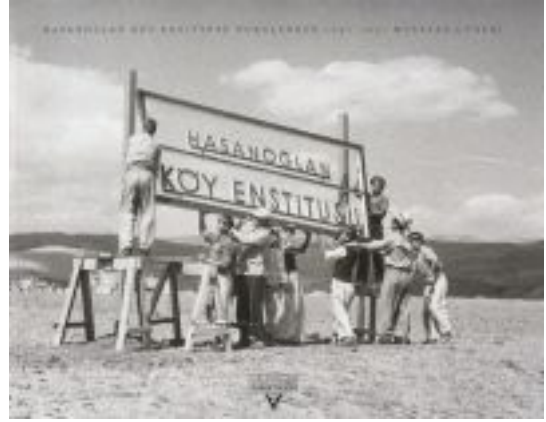
Hasanoğlu Köy Enstitüsü Ankara - Kayseri Demir Yolu, 35. km

Köy Enstitüleri'nde yaşam, dönemin öğretmen ve öğrencilerinin anlatımı ile tam "birliktelik, katılım, yetki" ve "sorumluluk"