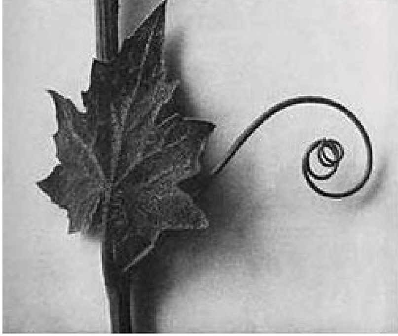
Karl Blossfeldt, "White Bryony"